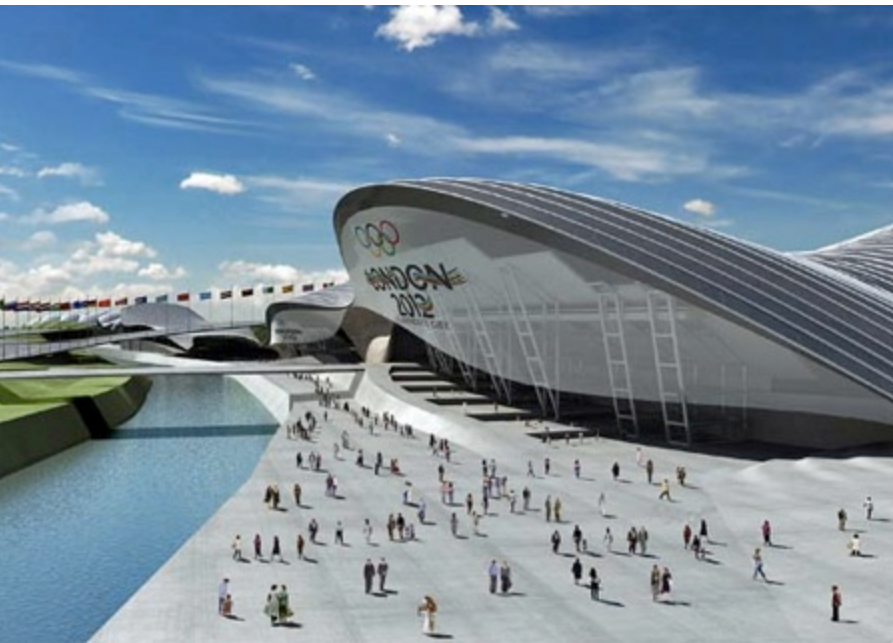
Лондон – иллюстрация проекта