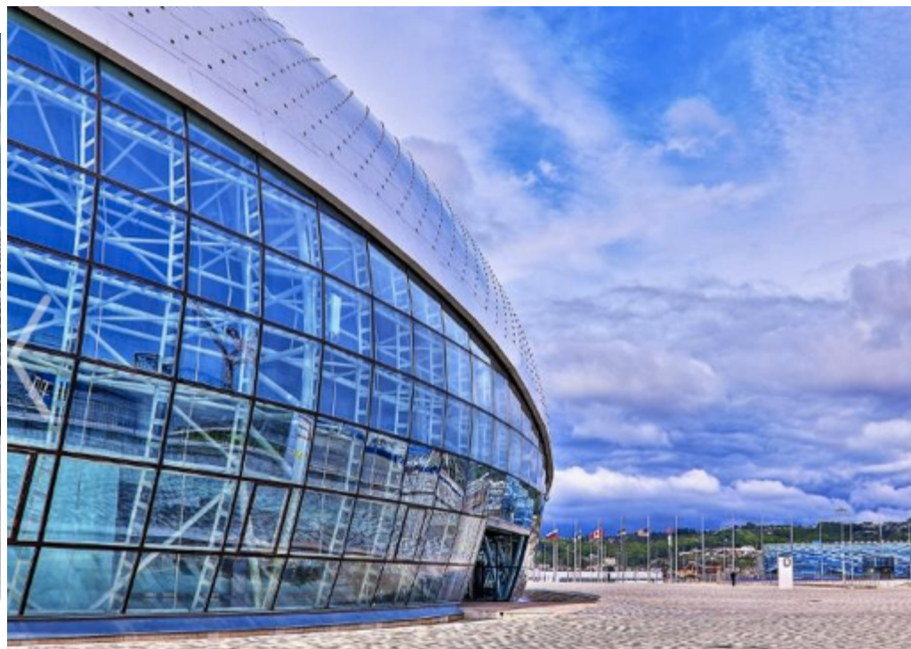
Сочи – изображение арен на официальном сайте ПОСЛЕ игр