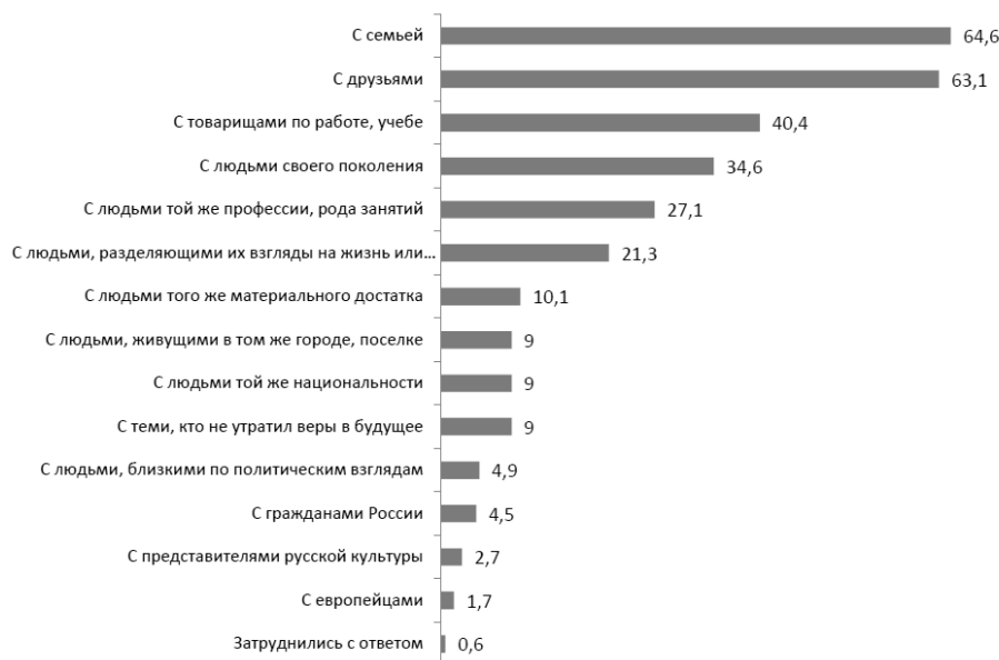
Рис. 12.1. Ответы на вопрос «С кем Вы часто ощущаете чувство общности?», % (допускалось несколько ответов, отранжировано по доле выбравших соответствующую позицию)

При том, что массовое сознание спешит приписать негативные свойства представителям конкретных национальностей, этническая самоидентификация — этническая идентичность отнюдь не самый популярный вектор самоидентификации. Наиболее близкими, как правило, оказываются семья (65%) и друзья (63%), товарищи по работе, учебе (40%), ровесники (35%), единомышленники (21%). С представителями своей национальности в 2012 г. себя ассоциировали лишь 9% опрошенных [3] (рис. 1).