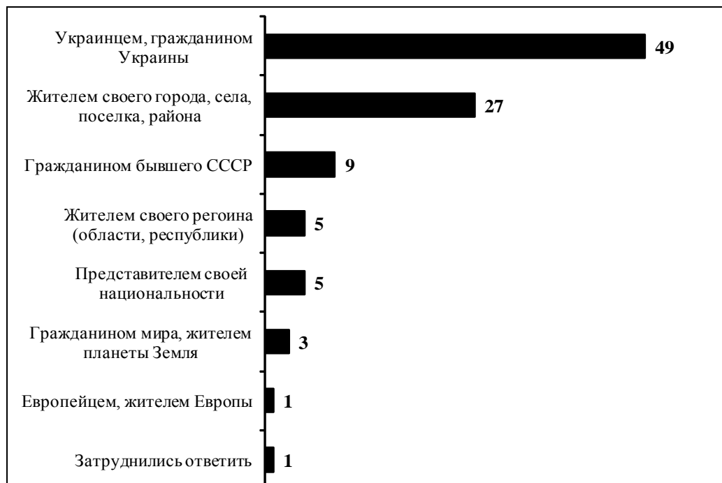
Рисунок 2 – Самоидентификация жителей Украины (кем респонденты считают/ощущают себя в первую очередь)

гражданами — называя себя украинцами (49%), каждый четвертый — идентифицирует себя со своим населенным пунктом (27%), каждый десятый считает себя советским человеком, гражданином бывшего СССР (9%), а каждый двадцатый житель страны прежде всего считает себя жителем своего региона, области (5%). или представителем своей национальности (5%) [4] (рис. 2).